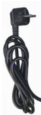
AC-virtajohto (tilattava erikseen)

Pistokevaihtoehdot: Eurooppa: CEE 7/7 UK: BS 1363 Australia/New Zealand: AS/NZS 3112