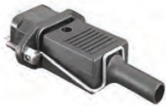
Pidäkejousi (mukana toimituksessa)