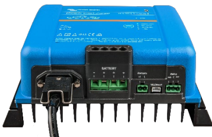
Phoenix Smart 12/50(3)