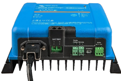
Phoenix Smart 12/50(1+1)